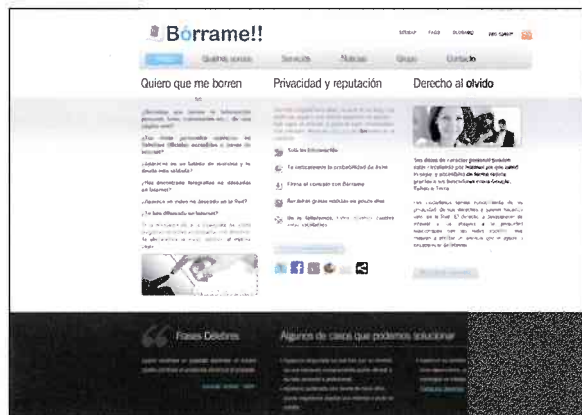
Desde Bórrame.es se lucha por defender el Derecho al olvido.

Lo que sí cuestiona es su responsabilidad en estos casos: Google remite a quien publica los datos para que los elimine y,