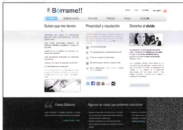
Desde Bórrame.es se lucha por defender el Derecho al olvido.

Lo que sí cuestiona es su responsabilidad en estos casos: Google remite a quien publica los datos para que los elimine y,