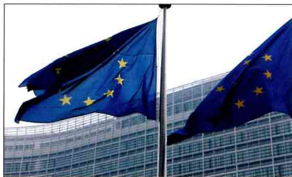
La Comisión Europea estudia regular el derecho al olvido.

al olvido. Ésta pretende reforzar las normas de protección de datos de la UE y adaptarlas a los cambios provocados por las nuevas tecnologías. Los proveedores de servicios de Internet (ISP) y los buscadores tendrán que limitar la recogida de datos al mínimo necesario y deberán informar a los usuarios de forma transparente sobre quién recoge y usa sus datos y sobre cómo, con qué fines y por cuánto tiempo lo hace.